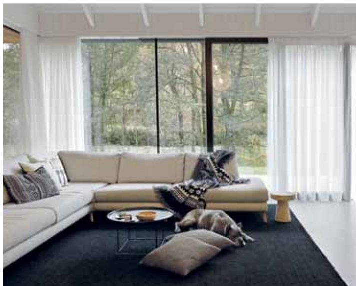
Rodinný dům Neveklov Spoluautor: Alžběta Vrabcová